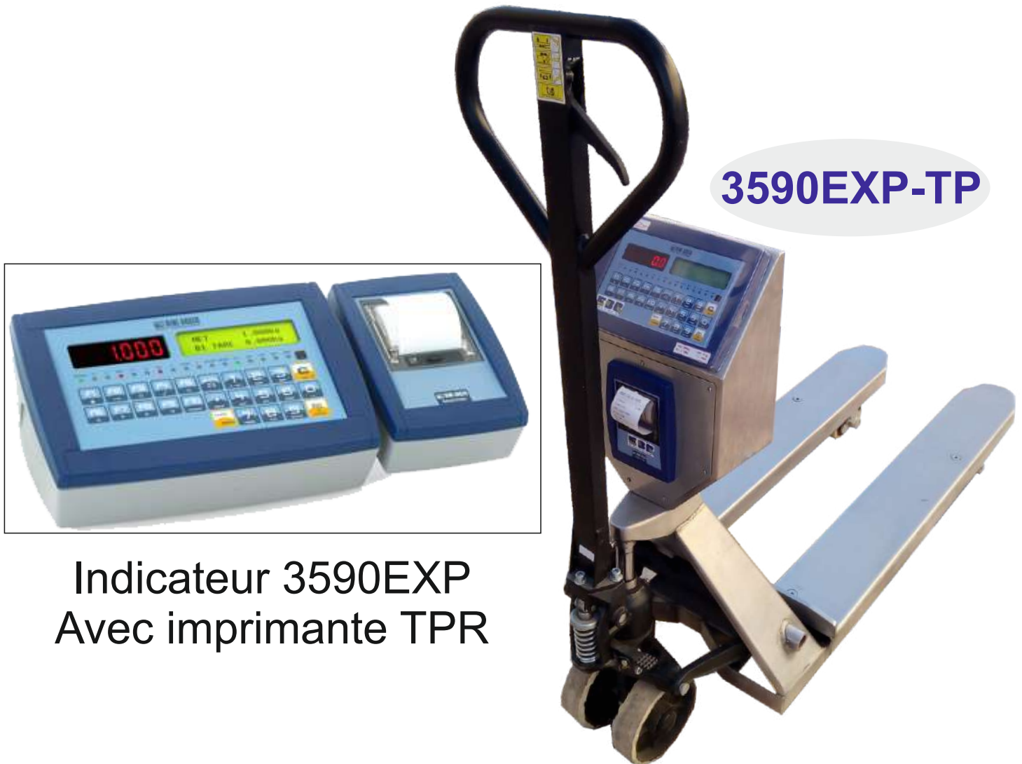
Indicateur 3590EXP Avec imprimante TPR

Transpalette peseur avec imprimante pour les applications industrielles avancées entièrement en inox doté d'indicateur avec clavier de fonction étanche avec protection contre la poussière et l'humidité suivant la norme IP65. Les fourches sont équipées de 4 capteurs type jauge de contrainte.